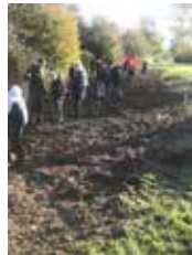
aan de slag