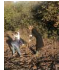
tips van de wethouder