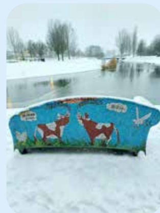
Locatie: mozaiekbankje achter het winkelcentrum Rijkerswoerd.