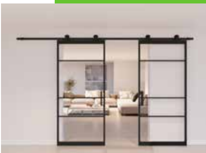
Deuren van Bosveld!