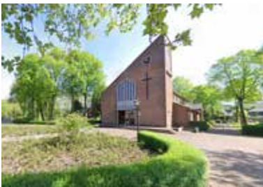
De Lucaskerk in Elden