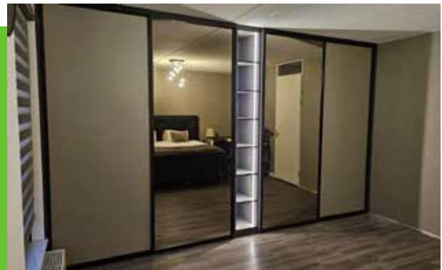
Wij maken de kast die past...