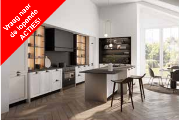
Keukens van Bosveld!