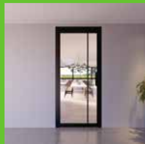
De industriële deur op maat...