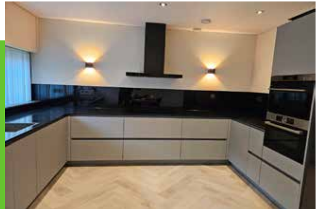
Vakmanschap dat je proeft...