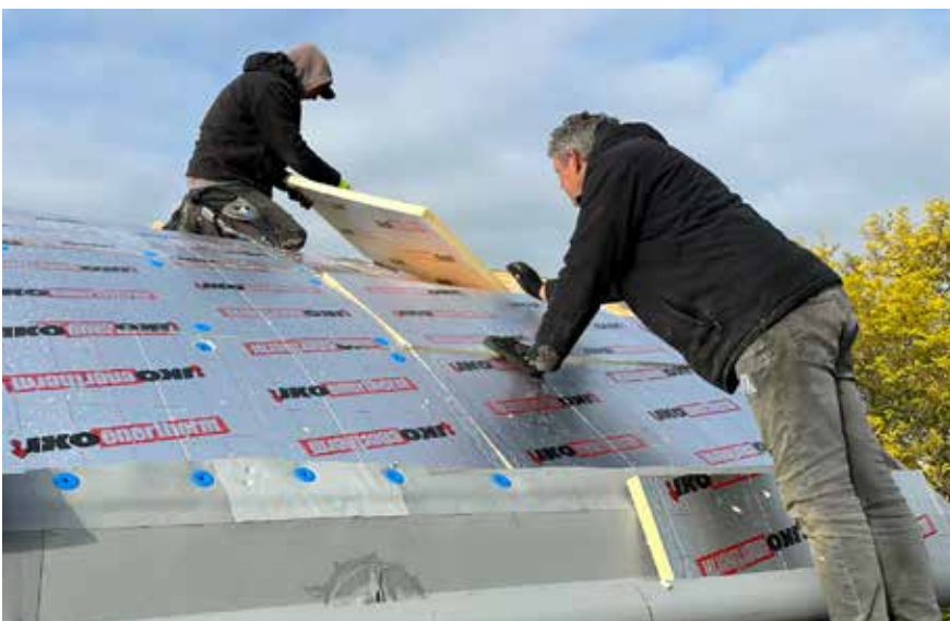
Werkgroep Duurzaam Rijkerswoerd