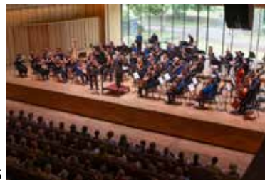
Arnhem Sinfoniëtta in Musis