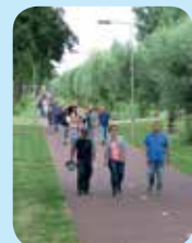
Foto voorzijde: avondvierdaagse