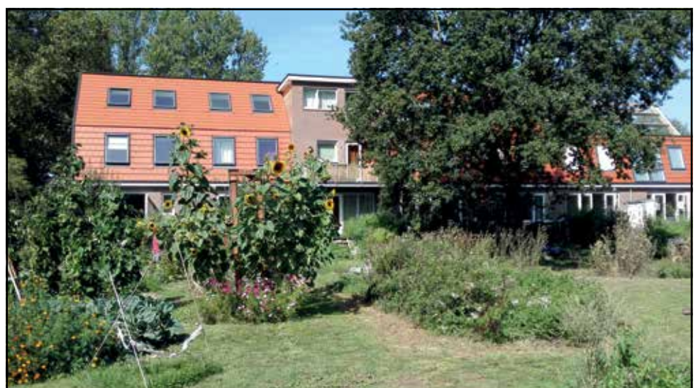
Nieuwbouw met moestuin