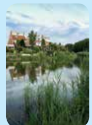
Foto voorzijde: blik op Elise Hoomanhof