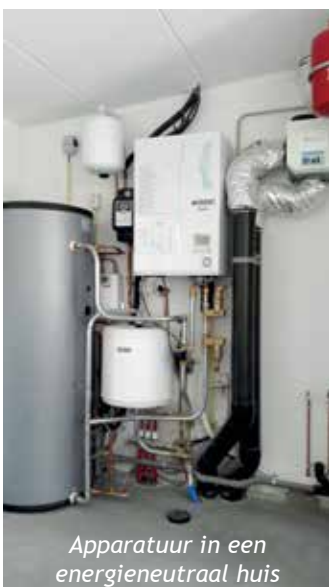
Apparatuur in een energieneutraal huis