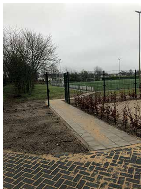
De toegang naar het sportcentrum