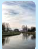
Foto voorzijde: Zicht op water achter het winkelcentrum