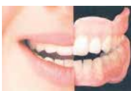
Bel voor een afspraak

Een specialistisch team staat garant voor kwaliteit en zorg