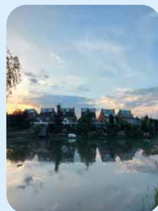
Locatie: woningen aan de Elise Hoomanshof.